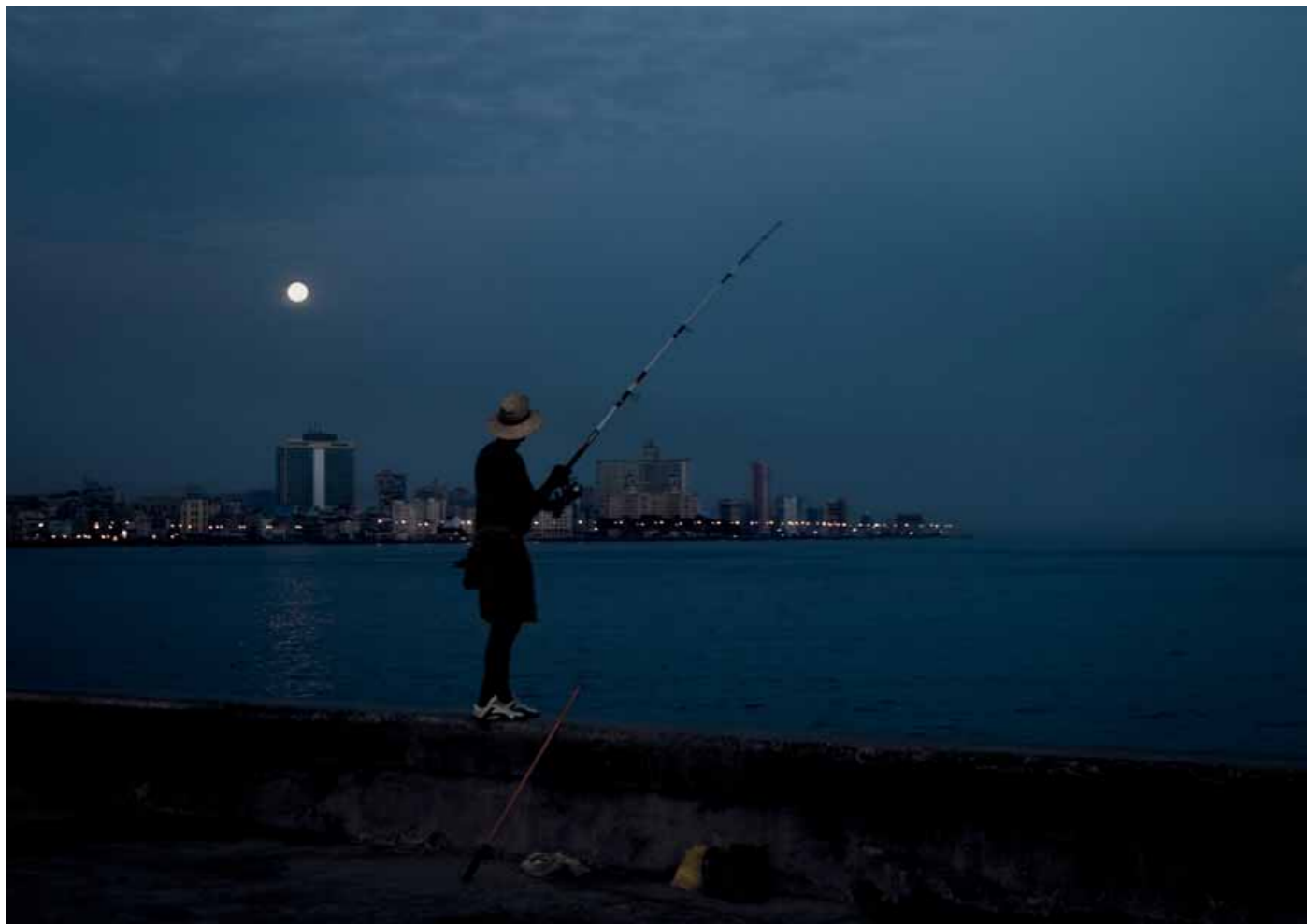
Am nächsten Morgen. Der Mond geht gerade unter. Ein neuer Shooting-Tag kann beginnen.

● Markenzeichen der Leica Camera Gruppe „Leica“ sowie Produktnamen = ® Registrierte Marke © 2009 Leica Camera AG HDMI, das HDMI Logo und „High-Definition Multimedia Interface“ sind Marken oder registrierte Marken von HDMI Licensing LLC. Änderungen in Konstruktion, Ausführung und Angebot vorbehalten Konzept und Gestaltung: argonauten G2, Frankfurt am Main Produktfotografie: Alexander Göhr Autorenfotografie: Thomas Stefan Prospekt-Bestellnummer: Deutsch 91430 / Englisch 91431 / Französisch 91432 / Japanisch 91433 / Spanisch 91434 / Holländisch 91435 / Italienisch 91436 / Russisch 91438 / Polnisch 91467, 09/2009 Leica Camera AG / Oskar-Barnack-Straße 11 / D-35606 Solms Telefon + 49(0)6442-208-0 / Telefax + 49(0)6442-2 08-333 / www.leica-camera.com