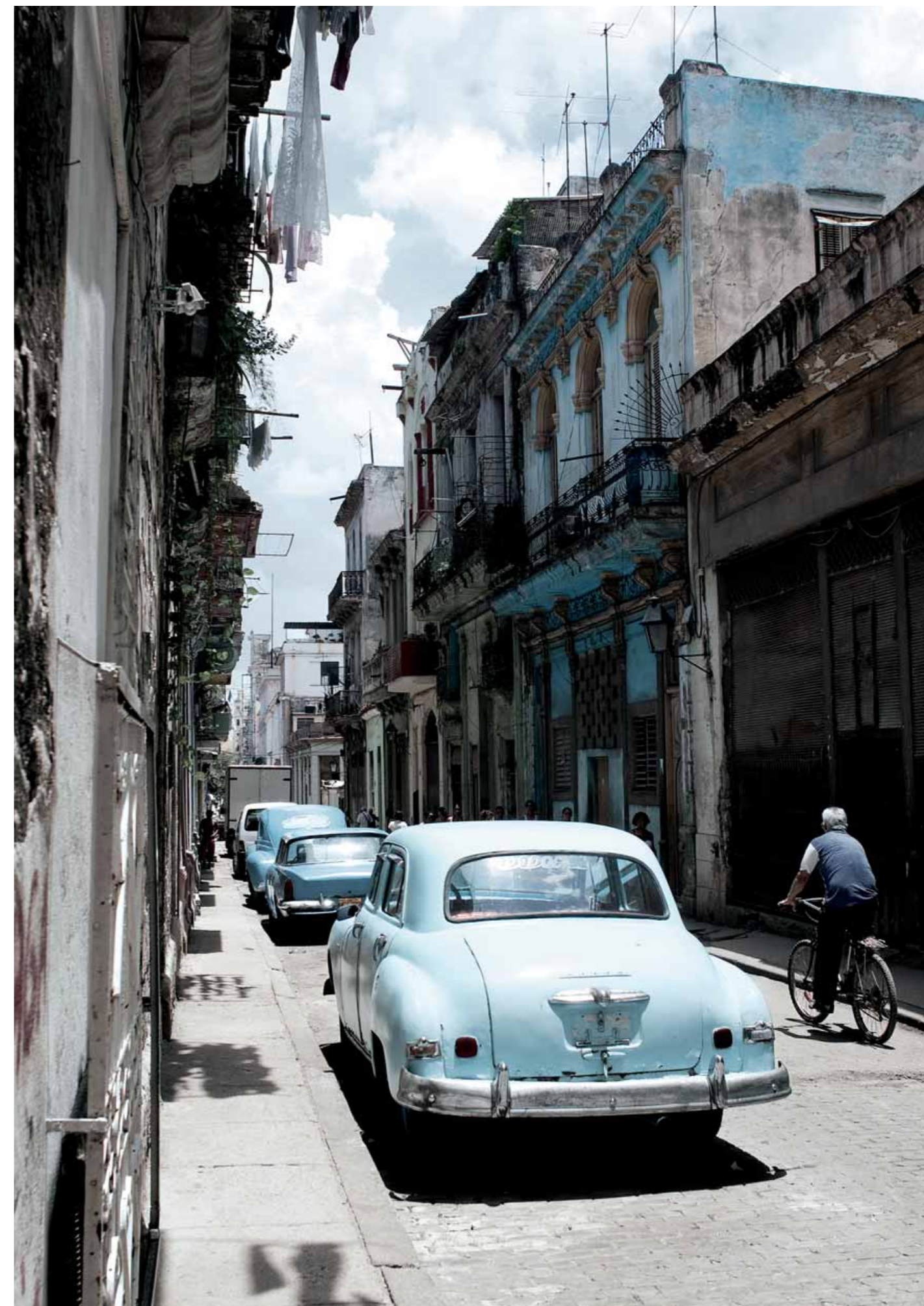
Auf dem Rückweg ins Hotel strahlt schon wieder die Sonne. Vergessen ist der heftige Schauer.