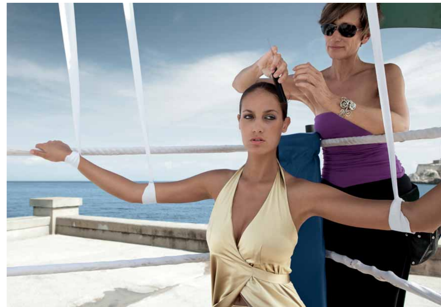
Styling-Wechsel: Für die nächsten Aufnahmen legt die Hair-und-Make-up-Stylisten noch einmal Hand an.

Die Welt ist in Bewegung. Und das ist gut. Mit der Leica X1 ist der Fotograf jetzt so flexibel, dass er Situationen und Eindrücke genau so einfangen kann, wie sie sind – lebensnah und unverfälscht. Der Autofokus stellt scharf, die Belichtungsautomatik stellt die Zeit und die Blende ein und die umfangreichen Automatikfunktionen spielen ihre Stärken aus. Klick! All das passiert auf Wunsch automatisch in Millisekunden. Doch der Fotograf kann blitzschnell selbst die Kontrolle übernehmen, um seine gestalterischen Freiheiten auszuschöpfen. Egal ob der Fotograf spontan oder bewusst kreativ sein möchte, die Leica X1 ist immer die richtige Wahl.