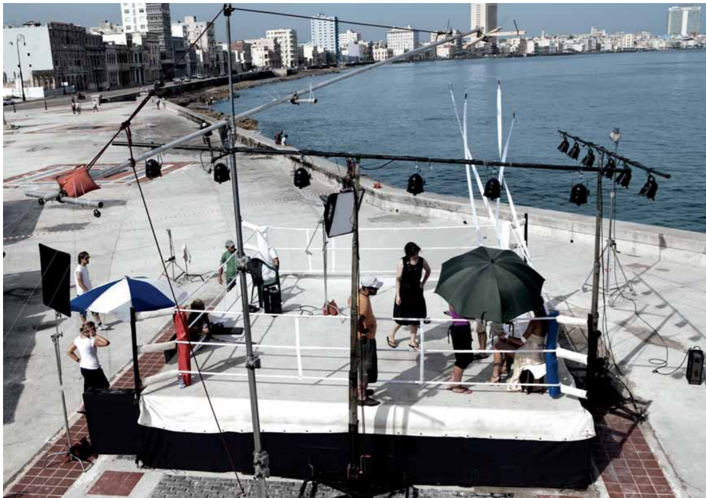
Am Malecón, die Vorbereitungen am Shooting-Set laufen auf Hochtouren: Aufbau, Lichteinstellungen, Blendentest.

Schon der erste Kontakt mit der Stadt reißt Thomas mitten ins Geschehen. Macht ihn zu einem Teil und nicht nur zum Betrachter. Havanna ist authentisch, ehrlich, offen. Eine Stadt, die eher an ein lebendiges Freilichtmuseum erinnert und dabei doch die viertgrößte Stadt der Karibik ist. Die unzähligen vorbeiziehenden Motive auf der Fahrt zum Malecón fängt er problemlos mit seiner Leica X1 ein. Denn die kompakte Leica X1 ist genauso spontan wie das Leben in der Stadt.