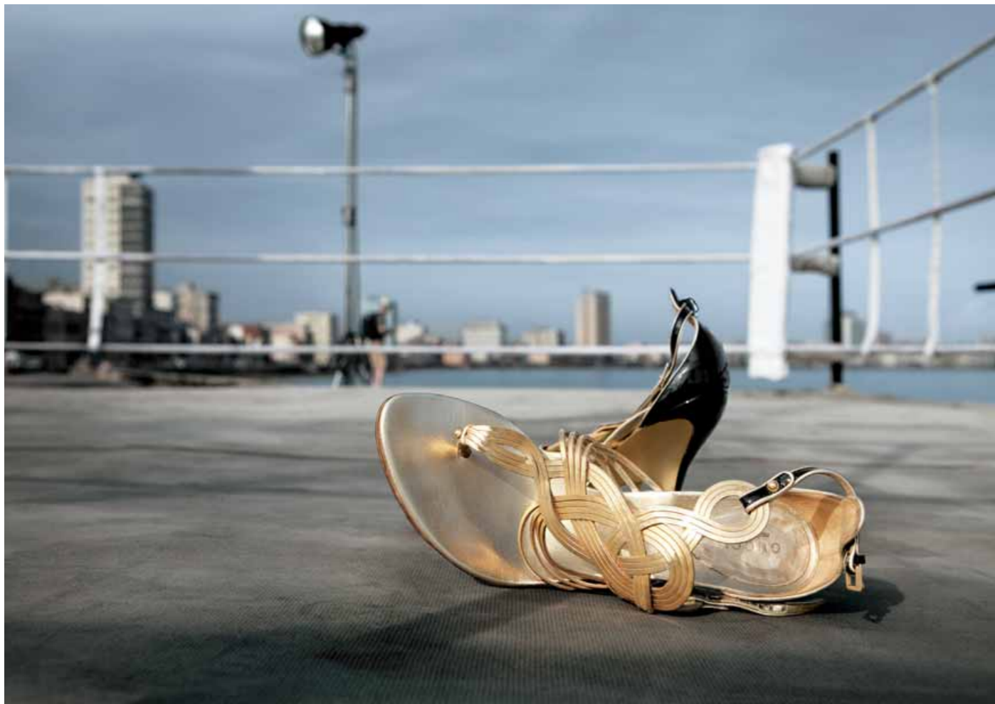
Kurze Pause. Füße vertreten und schnell eine Kleinigkeit essen, bevor das Shooting weitergeht.

Fotografien, die mit der Leica X1 entstehen, scheinen direkt aus dem Leben gegriffen. Kein Wunder, dass man manchmal auf den zweiten Blick etwas bislang Ungesehenes entdeckt. Das ist einer der Gründe, warum die Aufnahmen der Leica X1 so reizvoll und besonders sind. In der Leica X1 steckt ebenfalls mehr, als man auf den ersten Blick sieht. So präsentiert sich beispielsweise der Blitz erst dann, wenn er tatsächlich benötigt wird. Mit dem cleveren Zubehör speziell für die Leica X1 lässt sich die Kamera zudem sehr flexibel an die Anforderungen des Fotografen anpassen.